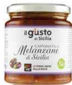
CAPONATA DI MELANZANE LIBERA LIBERA TERRA BIO - 270 GR