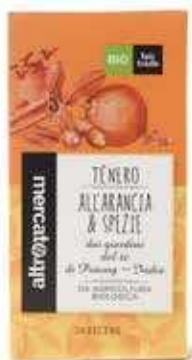
TÈ NERO ALL'ARANCIA E SPEZIE 20 FILTRI BIO - 40 GR