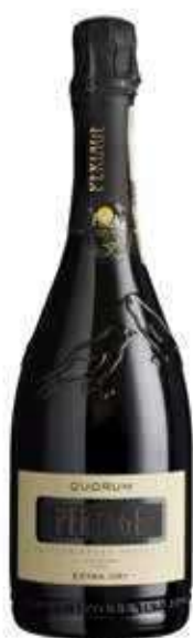
QUORUM PROSECCO SUPERIORE DOCG BIO - 750 ML