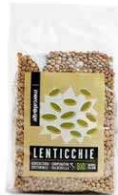
LENTICCHIE ESSICCATE BIO 500 GR