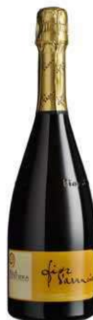
VINO MOSCATO DOCG FIORI D'ARANCIO BIO - 750 ML