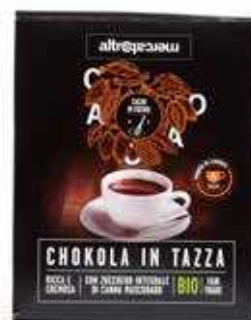
CHOKOLA CIOCCOLATA IN TAZZA BIO - 125 GR