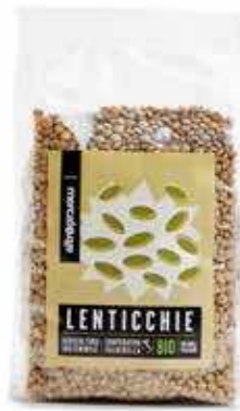
LENTICCHIE ESSICcate BIO - 500 GR