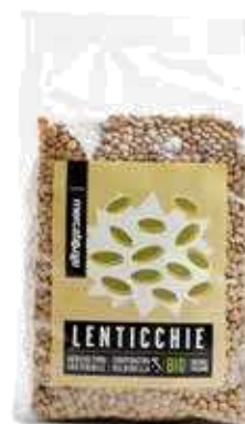
LENTICCHIE ESSICcate BIO 500 GR