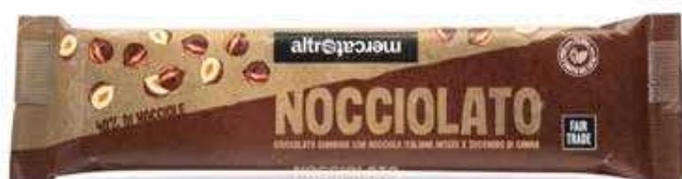
NOCCIOLATO GIANDUIA E NOCCIOLE INTERE 125 GR