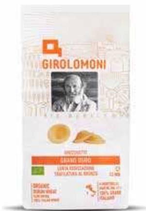
ORECCHIETTE PASTA DI SEMOLA GIROLOMONI BIO - 500 GR