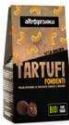
TARTUFI FONDENTI AGLI ANACARDI BIO - 120 GR