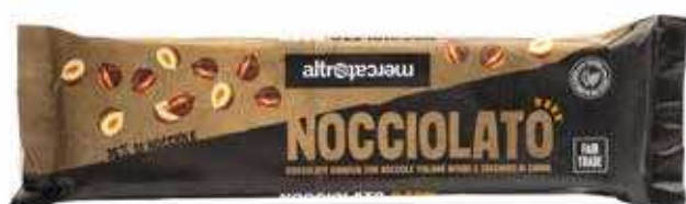
NOCCIOLATO DARK GIANDUIA E NOCCIOLE INTERE 125 GR