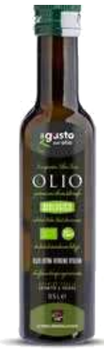
OLIO EXTRAVERGINE D'OLIVA LIBERA TERRA BIO - 500 ML