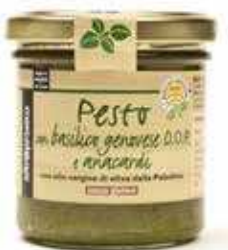
PESTO DI BASILICO DOP E ANACARDI 130 GR