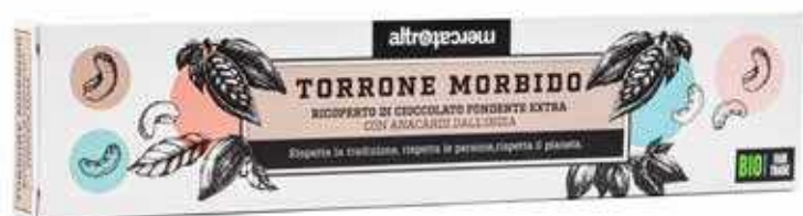
TORRONE MORBIDO RICOPERTO DI CIOCCOLATO BIO -90 GR