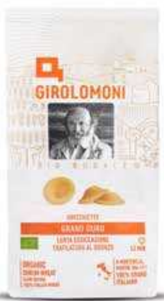
ORECCHIETTE PASTA DI SEMOLA GIROLOMONI BIO - 500 GR