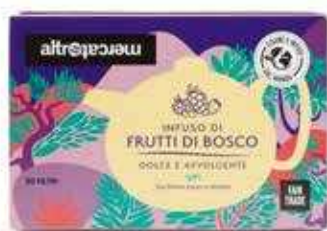
INFUSO FRUTTI DI BOSCO 20 BUSTINE - 40 GR