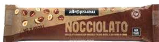
NOCCIOLATO GIANDUIA E NOCCIOLE INTERE 125 GR