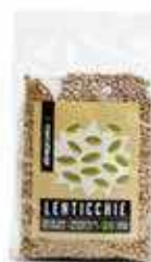
LENTICCHIE ESSICCATE BIO 500 GR