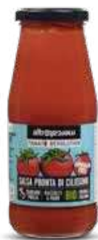
SALSA PRONTA DI CILIEGINO BIO - 410 GR