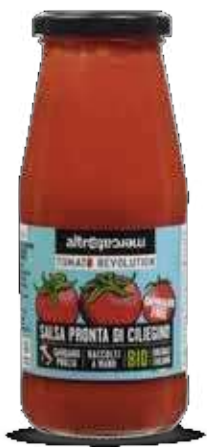
SALSA PRONTA DI CILIEGINO BIO - 410 GR