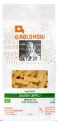
MACCHERONI DI GRANO DURO CAPPELLI GIROLOMONI BIO - 500 GR