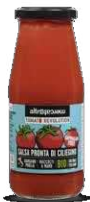
SALSA PRONTA DI CILIEGINO BIO - 410 GR