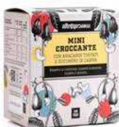
CROCCANTI DI ANACARDI MONOPORZIONE 120 GR