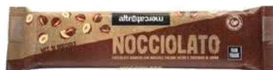
NOCCIOLATO GIANDUIA E NOCCIOLE INTERE 125 GR