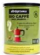
CAFFÈ 100% ARABICA IN LATTINA BIO - 250 GR