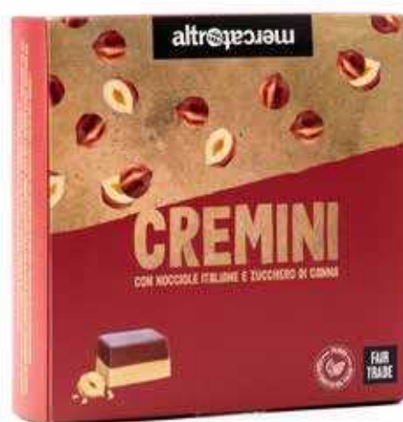
CREMINI CIOCCOLATINI BIGUSTO ALLA NOCCIOLA 250 GR