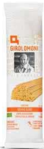
LINGUINE PASTA DI SEMOLA GIROLOMONI BIO - 500 GR