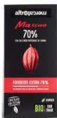
MASCAO CIOCCOLATO FONDENTE EXTRA 70% BIO - 100 GR