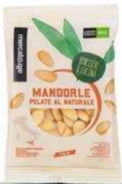
MANDORLE PELATE DI SICILIA BIO - 100 GR