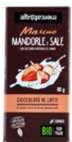
MASCAO CIOCCOLATO AL LATTE CON MANDORLE E SALE BIO - 80 GR