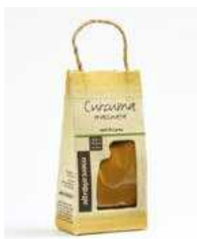
CURCUMA MACINATA 20 GR