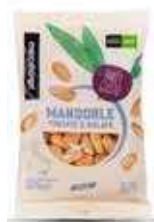
MANDORLE TOSTATE E SALATE BIO - 100 GR