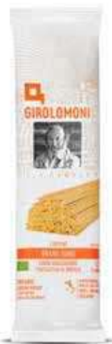
LINGUINE PASTA DI SEMOLA GIROLOMONI BIO - 500 GR