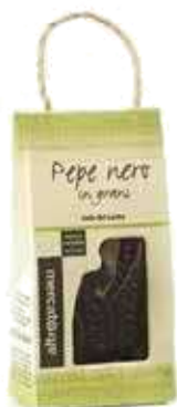
PEPE NERO IN GRANI 30 GR