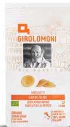
ORECCHIETTE PASTA DI SEMOLA GIROLOMONI BIO - 500 GR