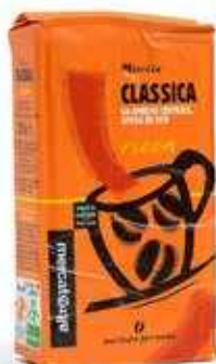
MISCELA CLASSICA MACINATO PER MOKA 250 GR