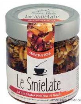
SMIELATA ARANCIA E ROSA 270 G