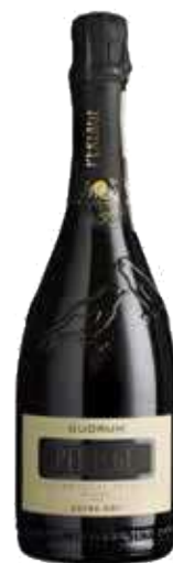
QUORUM PROSECCO SUPERIORE DOCG BIO - 750 ML