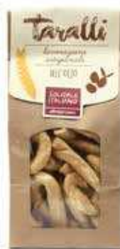
TARALLI ALL'OLIO EXTRAVERGINE D'OLIVA 250 GR