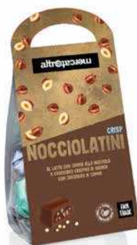
NOCCIOLATINI CRISP CIOCCOLATINI AL LATTE RIPIENI ALLA NOCCIOLA 120 GR