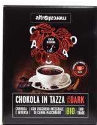
CHOKOLA - EXTRA DARK CIOCCOLATA IN TAZZA BIO 125 GR