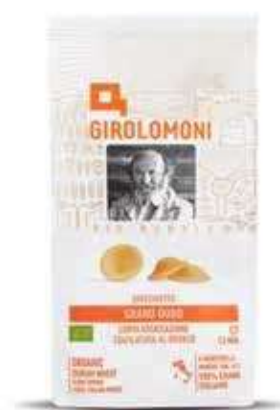
ORECCHIETTE PASTA DI SEMOLA GIROLOMONI BIO - 500 GR