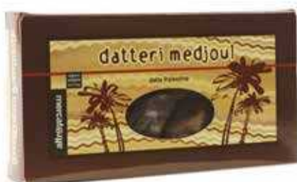
DATTERI MEDJOU AL NATURALE PALESTINA 200 GR