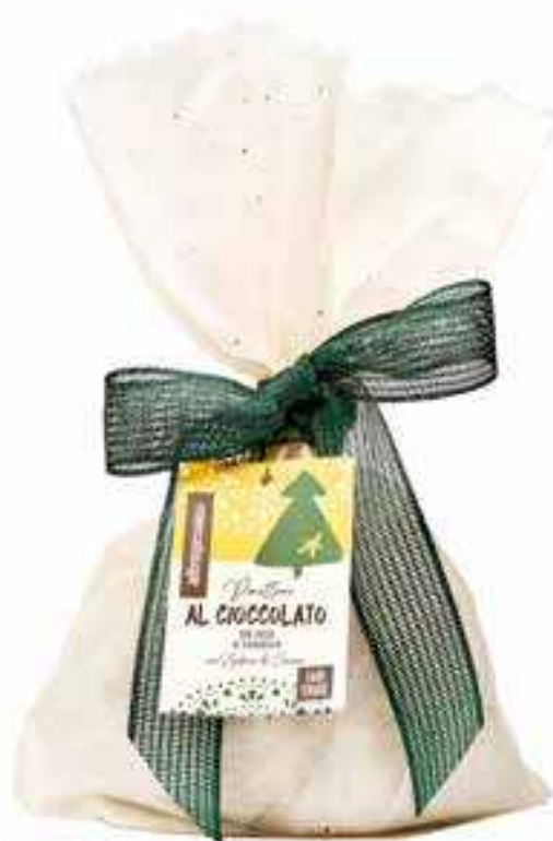
PANETTONE AL CIOCCOLATO CON GOCCE DI CIOCCOLATO 700 GR