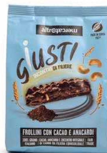
BISCOTTI CON CACAO E ANACARDI 300 GR