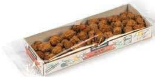
MANÌ ARACHIDI PRALINATE 100 GR