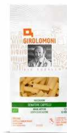
MACCHERONI DI GRANO DURO CAPPELLI GIROLOMONI BIO - 500 GR