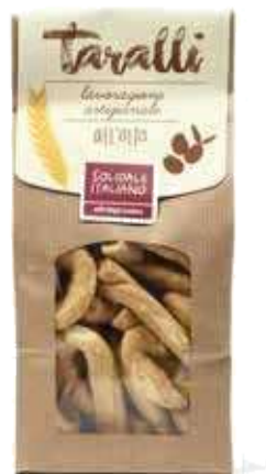
TARALLI ALL'OLIO EXTRAVERGINE D'OLIVA 250 GR