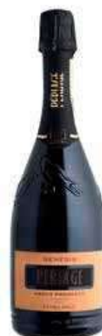
GENESIS - ASOLO PROSECCO SUPERIORE DOGC - EXTRA BRUT BIO - 750 ML