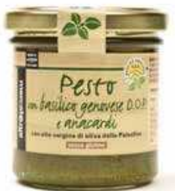
PESTO DI BASILICO DOP E ANACARDI 130 GR