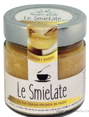
SMIELATA LIMONE E ZENZERO 270 GR