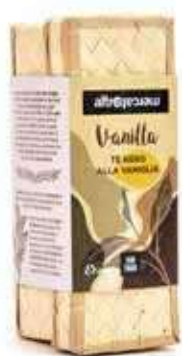
TÈ NERO ALLA VANIGLIA IN CESTINO 25 FILTRI - 37,5 GR