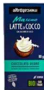
MASCAO CIOCCOLATO AL LATTE DI COCCO BIO - 80 GR