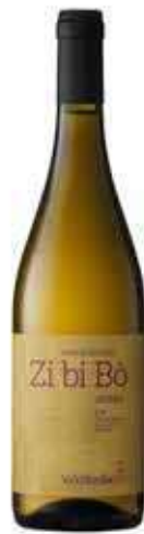
ZI BI BÒ TERRE SICILIANE IGP