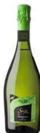
PROSECCO DOC EXTRA DRY VEGANO SGAJO BIO - 750 ML