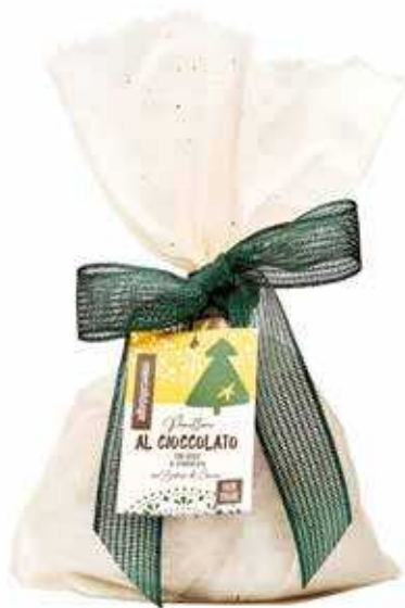
PANETTONE AL CIOCCOLATO CON GOCCE DI CIOCCOLATO 700 GR