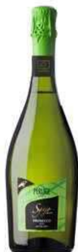
PROSECCO DOC EXTRA DRY VEGANO SGAJO BIO - 750 ML