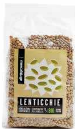
LENTICCHIE ESSICATE BIO 500 GR