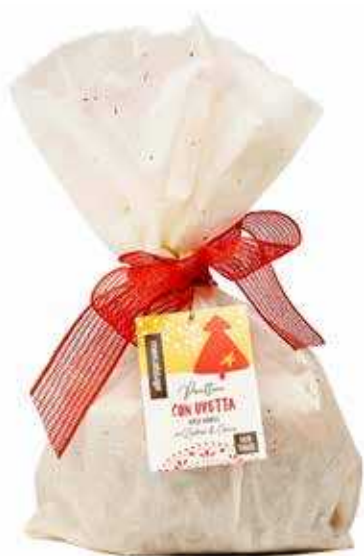
PANETTONE CON UVETTA SENZA CANDITI 700 GR