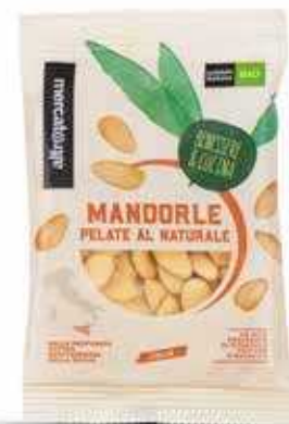
MANDORLE PELATE DI SICILIA BIO - 100 GR