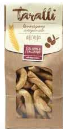
TARALLI ALL'OLIO EXTRAVERGINE D'OLIVA 250 GR