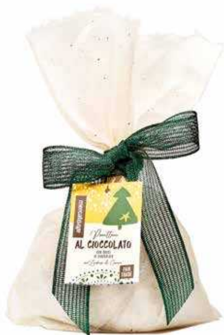
PANETTONE AL CIOCCOLATO CON GOCCE DI CIOCCOLATO 700 GR