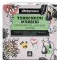
TORRONCINI MORBIDI PISTACCHIO E ANACARDI 120 GR