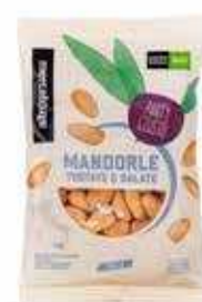
MANDORLE TOSTATE E SALATE BIO - 100 GR