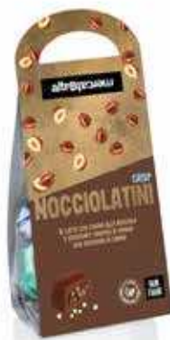
NOCCIOLATINI CRISP RIPIENI ALLA NOCCIOLA 120 GR