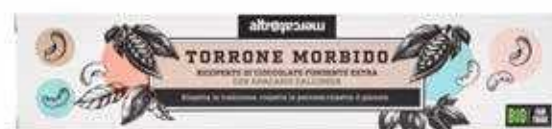
TORRONE MORBIDO RICOPERTO STECCA BIO - 100 GR