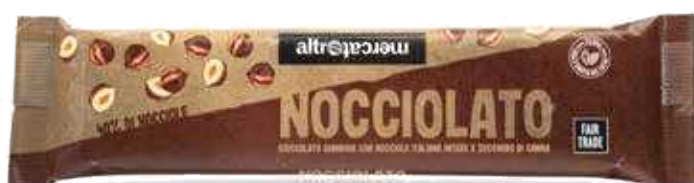
NOCCIOLATO CANDUIA E NOCCIOLE INTERE 125 GR