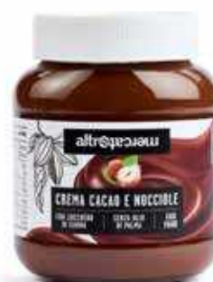
CREMA AL CACAO E NOCCIOLE 400 GR