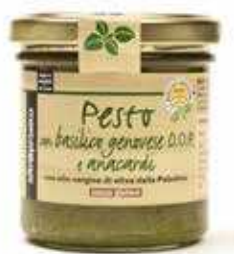
PESTO DI BASILICO DOP E ANACARDI 130 GR