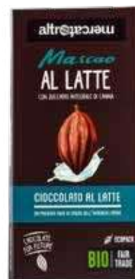
MASCAO CIOCCOLATO AL LATTE BIO - 100 GR