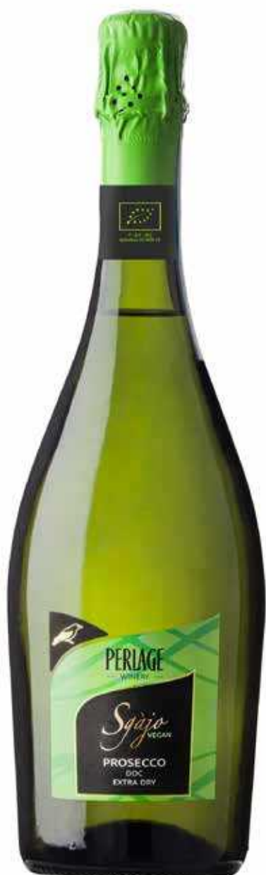
PROSECCO DOC EXTRA DRY VEGANO SGAJO BIO - 750 ML