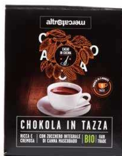
CHOKOLA CIOCCOLATA IN TAZZA BIO 125 GR