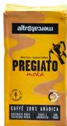
PREGIATO MOKA CAFFÈ 100% ARABICA 250 GR