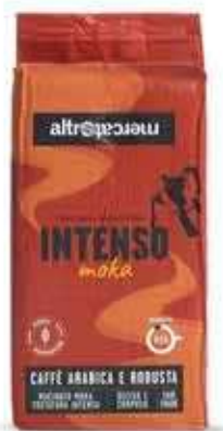
MISCELA INTENSA MACINATO PER MOKA 250 GR