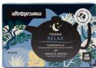
TISANA RELAX 20 BUSTINE 40 GR