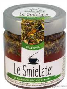
SMIELATA DIGESTIVA 270 GR