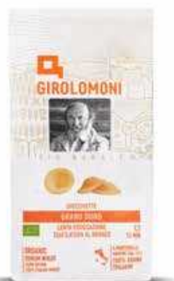
ORECCHIETTE PASTA DI SEMOLA GIROLOMONI BIO - 500 GR