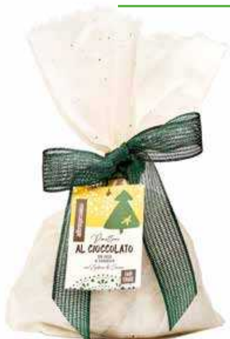
PANETTONE AL CIOCCOLATO CON GOCCE DI CIOCCOLATO 700 GR