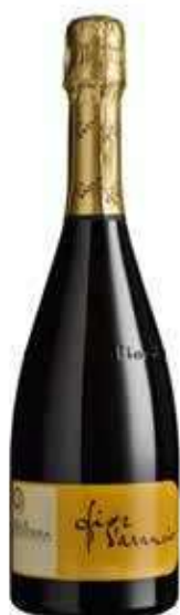
VINO MOSCATO DOCG FIORI D'ARANCIO BIO - 750 ML