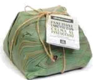
PANETTONE FARCITO CON CREMA AL PISTACCHIO 750 GR