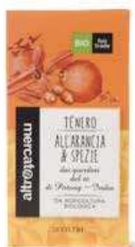
TÈ NERO ALL'ARANCIA E SPEZIE 20 FILTRI BIO - 40 GR