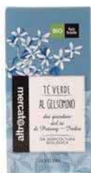
TÈ VERDE AL GELSOMINO 20 FILTRI BIO - 40 GR