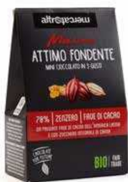
ATTIMO FONDENTE MINI CIOCCOLATO MASCAO IN 3 GUSTI BIO - 130G