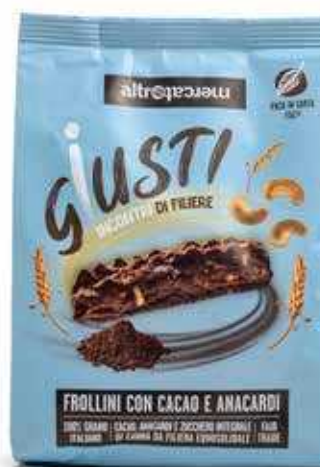
BISCOTTI CON CACAO E ANACARDI 300 GR