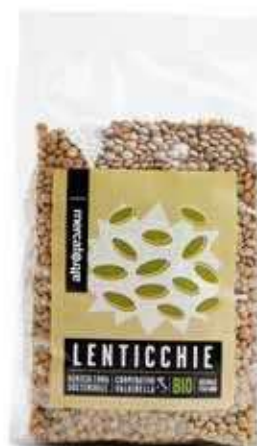
LENTICCHIE ESSICcate BIO 500 GR