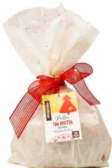
PANETTONE CON UVETTA SENZA CANDITI 700 GR