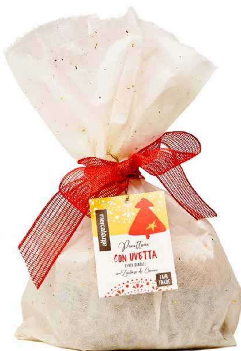
PANETTONE CON UVETTA SENZA CANDITI 700 GR