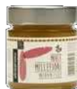
MIELE MILLEFIORI VALDIVIA 300 GR