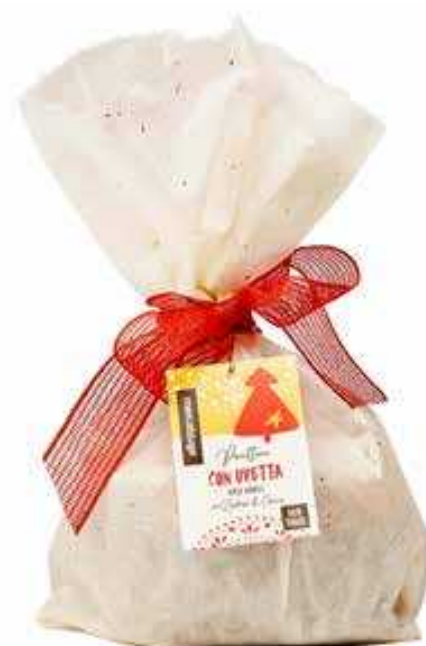
PANETTONE CON UVETTA SENZA CANDITI 700 GR