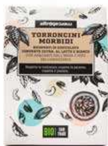
TORRONCINI RICOPERTI BIO - 180 GR