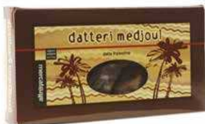
DATTERI MEDJOU AL AL NATURALE PALESTINA 200 GR