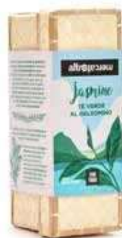
GELSOMINO IN CESTINO TÈ VERDE AL 25 FILTRI - 37,5 GR