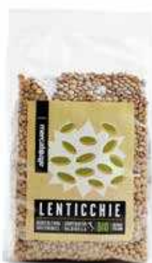
LENTICCHIE ESSICcate BIO - 500 GR