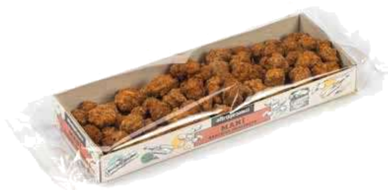
MANÌ ARACHIDI PRALINATE 100 GR