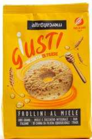
BISCOTTI AL MIELE 300 GR