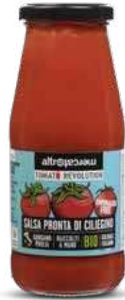
SALSA PRONTA DI CILIEGINO BIO - 410 GR