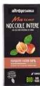
MASCAO CIOCCOLATO FONDENTE EXTRA CON NOCCIOLE INTERE BIO - 100 GR