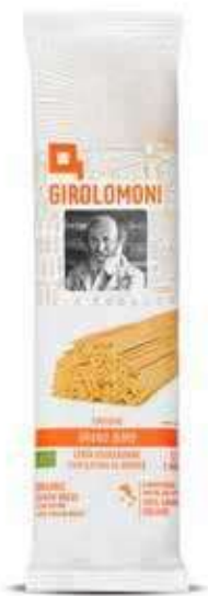
LINGUINE PASTA DI SEMOLA GIROLOMONI BIO - 500 GR

Tutti i prodotti di questa proposta sono MADE IN ITALY