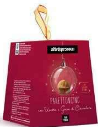
PANETTONCINO GOCCE DI CIOCCOLATO E UVETTA 100 GR