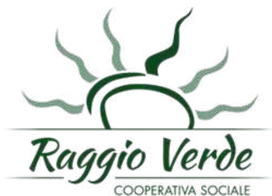
Art Direction: Simona Placci Copywriter: Elisa Costa