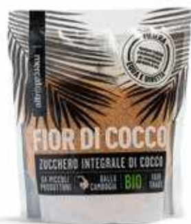
ZUCCHERO DI COCCO BIO - 250 GR