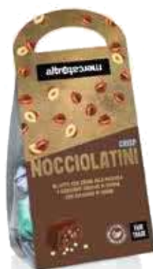
NOCCIOLATINI CRISP CIOCCOLATINI AL LATTE RIPIENI ALLA NOCCIOLA 120 GR