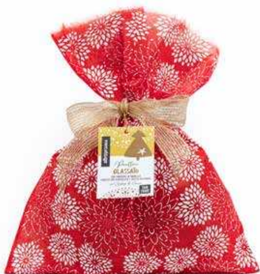
PANETTONE GLASSATO CON GOCCE DI CIOCCOLATO E UVETTA 750 GR