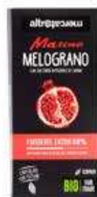
MASCAO CIOCCOLATO FONDENTE EXTRA AL MELOGRANO BIO - 80 GR