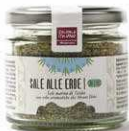
SALE ALLE ERBE DI SICILIA BIO - 95 GR