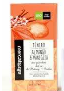
TÈ NERO AL MANGO E VANIGLIA 20 FILTRI BIO - 40 GR