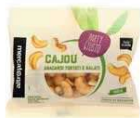
CAJOU ANACARDI TOSTATI E SALATI 50 GR