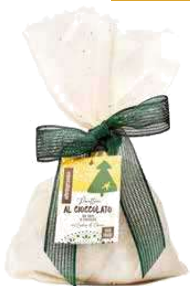
PANETTONE AL CIOCCOLATO CON GOCCE DI CIOCCOLATO 700 GR