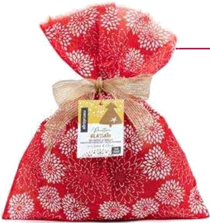
PANETTONE GLASSATO CON GOCCE DI CIOCCOLATO E UVETTA 750 GR