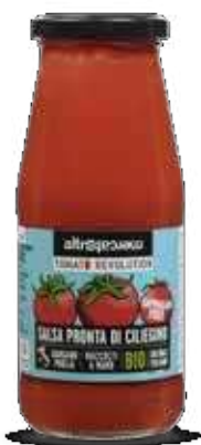
SALSA PRONTA DI CILIEGINO BIO - 410 GR