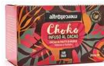
CHOKO - INFUSO CACAO AI FRUTTI DI BOSCO 20 FILTRI - 40 GR