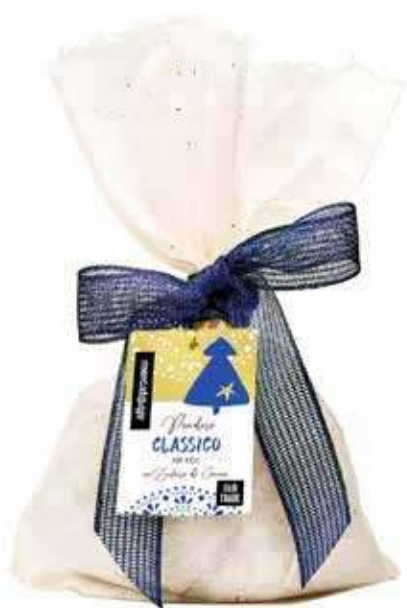
PANDORO CLASSICO CON ZUCCHERO A VELO DI CANNA 700 GR