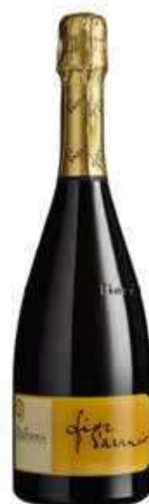
VINO MOSCATO DOCG FIORI D'ARANCIO BIO - 750 ML