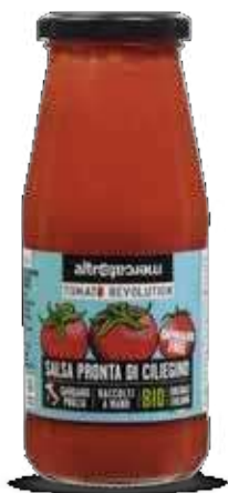
SALSA PRONTA DI CILIEGINO BIO - 410 GR