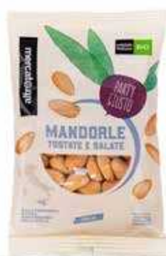
MANDORLE TOSTATE E SALATE BIO - 100 GR