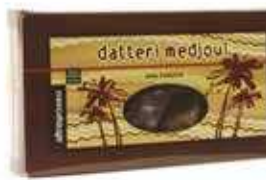
DATTERI MEDJOL AL NATURALE 200 GR