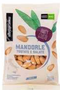
MANDORLE TOSTATE E SALATE BIO - 100 GR