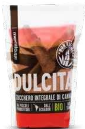
MASCOBADO ZUCCHERO INTEGRALE DI CANNA BIO - 500 GR