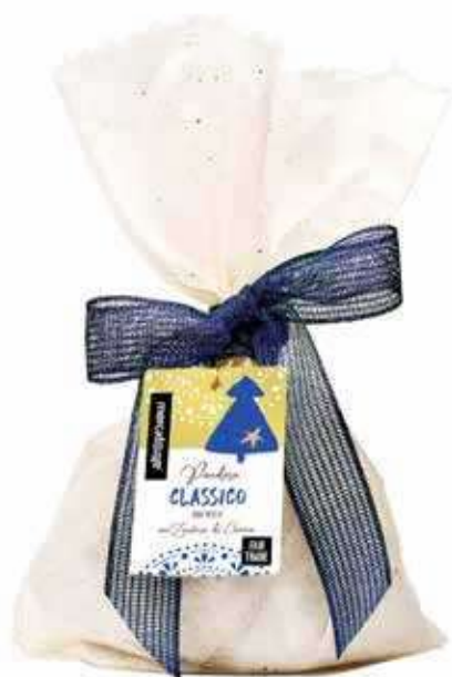
PANDORO CLASSICO CON ZUCCHERO A VELO DI CANNA 700 GR