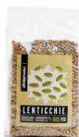
LENTICCHIE ESSICcate BIO 500 GR