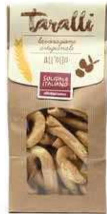
TARALLI ALL'OLIO EXTRAVERGINE D'OLIVA 250 GR