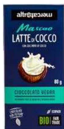
MASCO CIOCCOLATO AL LATTE DI COCCO BIO - 80 GR