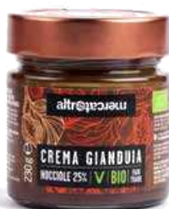
CREMA GIANDUIA BIO - 230G