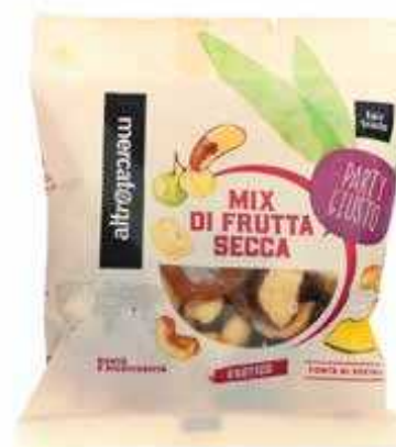
MIX DI FRUTTA SECCA ASSORTITA 100 GR