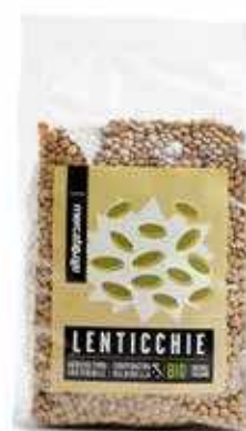
LENTICCHIE ESSICcate BIO 500 GR