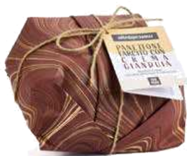
PANETTONE FARCITO CON CREMA GIANDUIA 750 GR