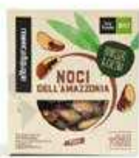
NOCI DELL'AMAZZONIA SGUSCIATE BIO - 150 GR