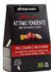
ATTIMO FONDENTE MINI CIOCCOLATO MASCAO IN 3 GUSTI BIO - 130G