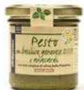
PESTO DI BASILICO D.O.P. E ANACARDI 130 GR