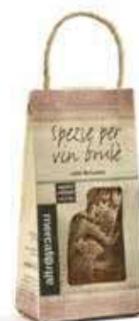
SPEZIE PER VIN BRULÈ 7,5 GR